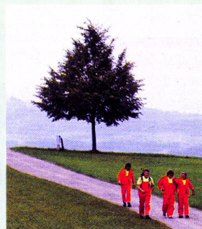
In diesem Jahr werden ungefähr 500 Teilnehmer aus der ganzen Schweiz erwartet.

Ab 19 Uhr können die Besucher und Teilnehmer die Abendunterhaltung geniessen. Die Partyband «Alpenrappere» aus Österreich und die Degersheimer Guggenmusik «Ruck-Zuck Schränzer» werden ihr Repertoire zum Besten geben. Zudem wird ein Barbetrieb für das Wohl der Teilnehmer und natürlich der Besucher sorgen. Weitere Informationen zum diesjährigen Feuerwehrmarsch erhält man unter www.feuerwehrmarsch.ch .